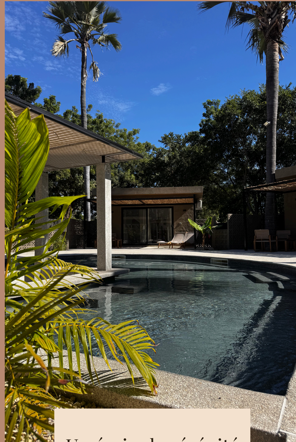
Un écrin de sérénité