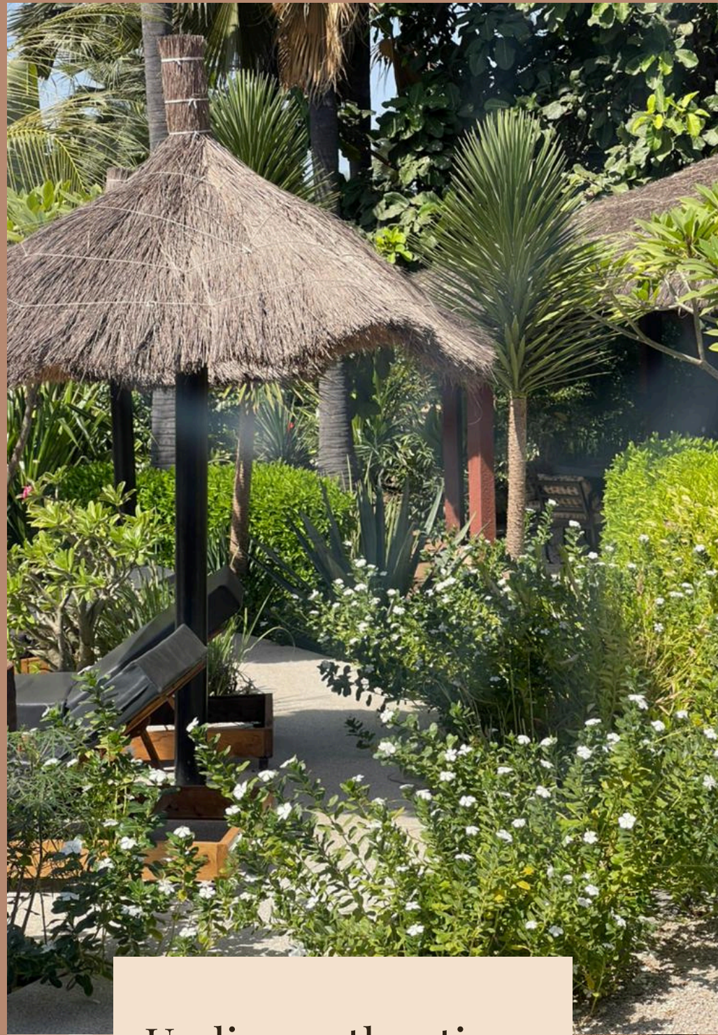
Un lieu authentique