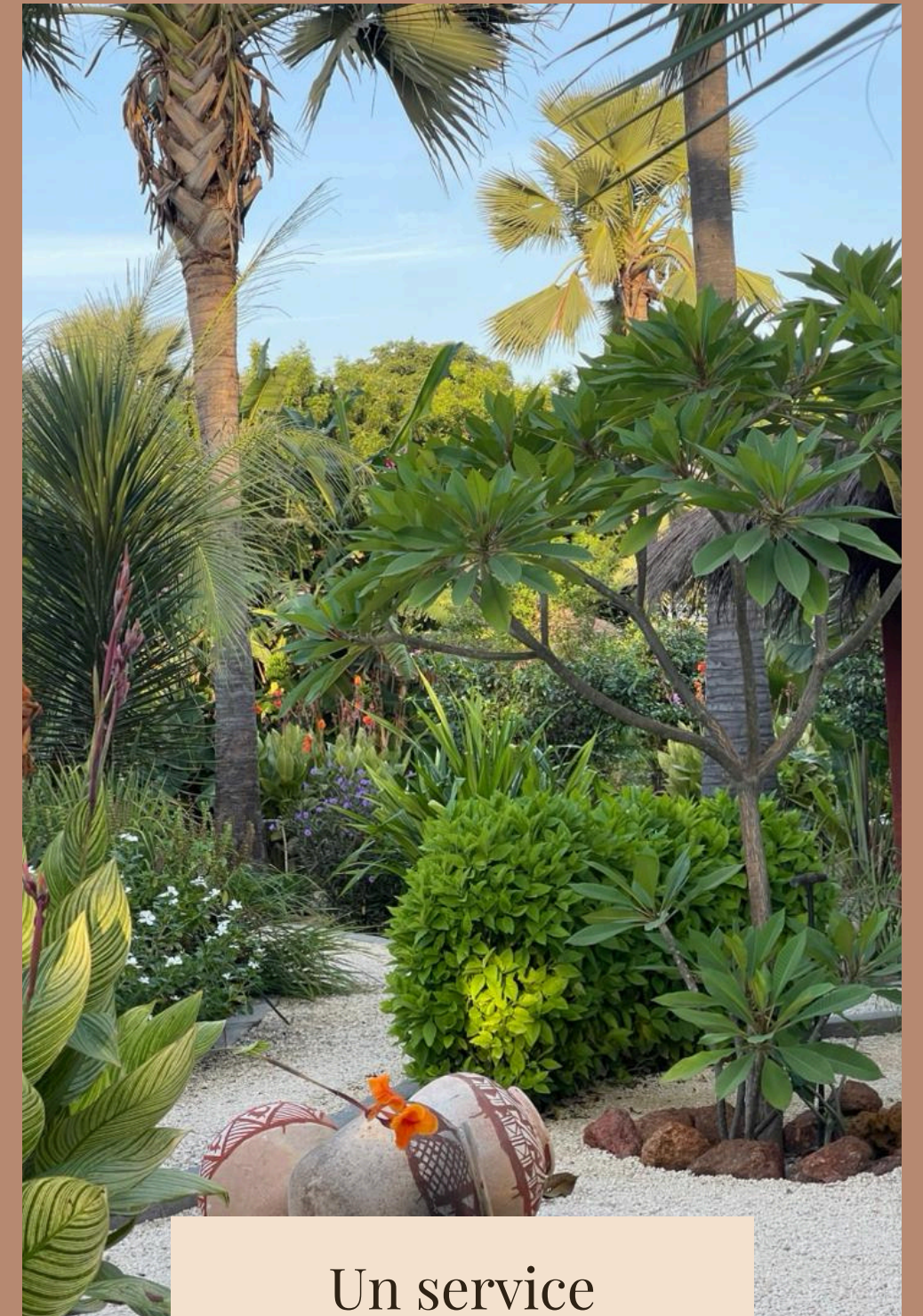
Un service personnalisé