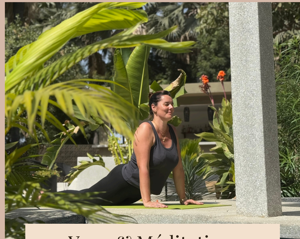
Yoga & Méditation

Partez à la découverte de nos différents massages et laissez vous transporter dans une bulle de bien être.